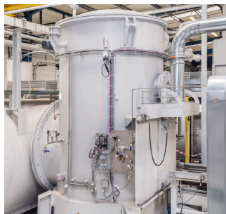
ECM USA, INC. Tel.: +1 262 605 4810 info@ecm-usa.com