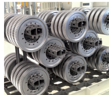
ECM FURNACE INDIA PVT. LTD. Tel.: +33 (0)4 76 49 65 60 info@ecmtech.fr