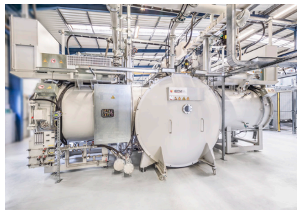
ECM (CHINA) CO. LTD. Tel.: +86 10 85802642/3 ext.101 contact.b@ecm-china.com